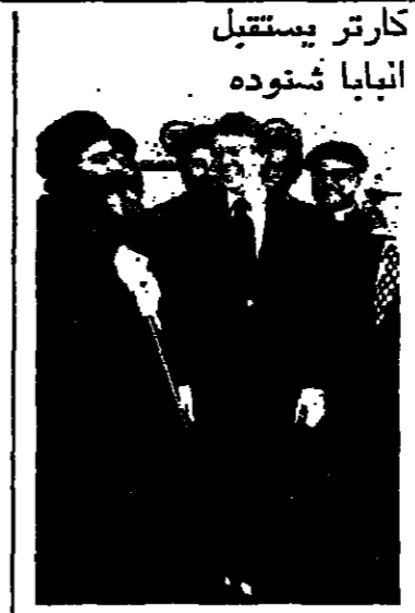
كارتر يستقبل انبيا شتوده

تلقت من صاحب التوقيع ما يلي: «أبعث اليكم بأحسن تحياتي راجيا ان تبلغوا متلها صاحبكم الدكتور شارل مالك في مساندة السليفة التي تعيشان فيها...»